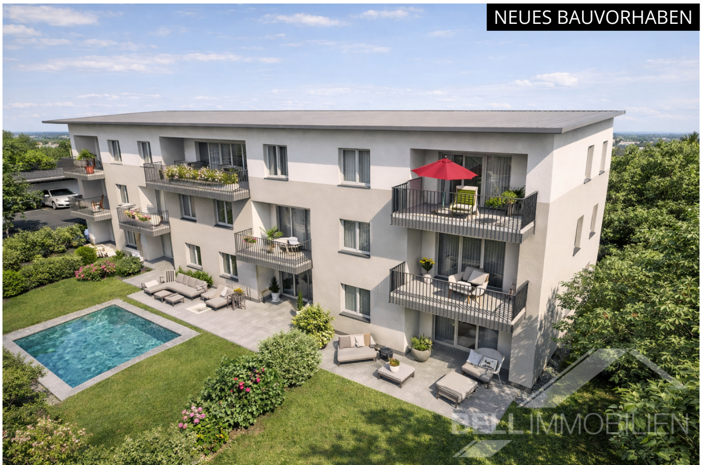
KI generierte Visualisierung MFH Mattighofen

Moderne Architektur, zukunftsorientierte Heiztechnik und absolute Sonnen- und Ruhelage!